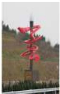
图3 《子昂故里》公共雕塑

线的运动,并置于三维空间中,使其随笔划的不断变化、逆转、运动,而成为一种具有三维立体的图像。观者可以通过不同的视角来体验、感悟文字雕塑的无穷魅力。如笔者创作的位于四川射洪的“子昂”公共雕塑,见图3,以唐代文学家陈子昂的名字作为创