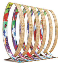
图1 竹制靠背镂空椅 Fig.1 Bamboo chair with pierced bac

但这些劳作生活用品往往比较粗糙,粗犷有余而美观不足,如果能把农民画的装饰性应用于劳作用品的设计开发,不仅能弥补其缺陷,还将会形成独具特色的农产品文化创意产业。例如第七届文博会期间深圳紫苑策划公司推出的竹制靠背镂空椅,见图1,从材质上看,竹编本身给人自然、环保之感,再配以质朴、清新的农民画装饰元素,赋予了产品独特的田园休闲气息。又如农民画创意工作坊所展示的提篮和竹匾的创意设计,见图2,利用农民画对提篮、竹匾等日常农具加以装饰,使这些本来朴实无华的农村劳作用品不仅具备了使用价值,同时还体现出独特的艺术美感,深受现代都市文化休闲场所的欢迎,极具农村特色,为休闲会所、文化场馆增添了别样的乡村文化情趣。