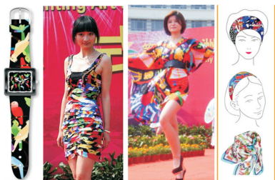
图6 腕表、时装及丝巾设计 Fig.6 Watches, fashion and silk scarves design

行再设计和再开发,有利于形成地方特色品牌,促进文化创意产业的推广。选择合适的创意角度,结合现代设计的开发理念,在传承的基础上对传统民间艺术进行研究与开发,是未来本土创意产品开发的主流趋势之一 [5] 。