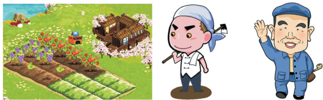
图9 开心农场游戏场景及人物角色

农民画的满版构图和视觉呈现形式非常符合模拟经营类游戏场景的设计要求,只需对农民画进行简单的设计改良就可用作游戏的场景,此外,农民画中的人物形象也可直接转化为游戏角色形象,见图9。游戏角色形象大都造型简洁、特征突出,这正是农民画以线造型、平涂填色的绘画手法。因此,在游戏场景和人物角色设计中可直接采用农民画中的形象。