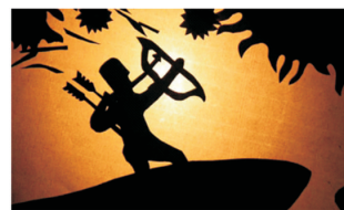
图7 剪纸动画《后羿射日》 Fig.7 Paper-cut animation "Hou Yi Shoots the Suns"

农民画可以借用动漫艺术的形式加以拓展与推广。虽画面静止,但构图却是动态的,在表达叙事情节时,把不同的时间、空间和事件进行叠加,融于一个画面,以此来表达一个完整的故事,这种方式可直接为动漫艺术所用。因此,可利用数字媒体技术将农民画改造成动漫作品。比如剪纸艺人王德林将剪纸与数字媒体艺术结合,创作了《后羿射日》等剪纸艺术动画作品,见图7;复旦大学的师生利用皮影这一艺术形式,设计制作了皮影版的《梁祝》动画,见图8。