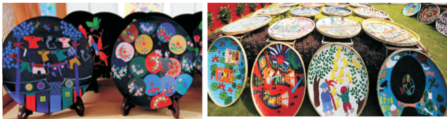
图3 农民画装饰瓷盘 Fig.3 Painting decorative porcelain