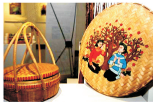
图2 提篮和竹匾 Fig.2 Shopping basket and bamboo sieve