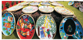
图4 农民画装置 Fig.4 Farmer paintings device

源,很多企业标志形象设计的灵感都来源于农民画,设计师运用画中的人物形象,进行提炼,最终形成企业标志。如老王头五谷杂粮公司和喜农乐农品公司的标志设计,见图5。农民画与现代装饰设计相结合,让其生长于日常生活环境中,使其成为一种洁净、高效的生产力 [9] ,这也是在新的市场环境下对农民艺术设计应用的重要方式。