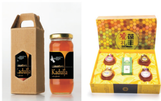
图6 单瓶和四瓶装蜂蜜

Fig.6 Single bottle and four bottles of honey