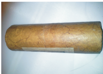
图1 清代羊皮包装的普洱茶 Fig.1 Pu'er tea packaging by Qing Dynasty sheepskin

文质兼备是强调形成和功能的统一,避免出现“质胜文则野,文胜质则史”的极端现象,使“文”和“质”和谐统一,相得益彰 [4] 。在包装设计的功能上,以服务于人为根本目的,在物质和精神上满足人们的生活需求。同时,文质兼备又强调内容与形式的统一,优秀的包装设计应该实现装饰和其自身属性的统一,用形式来表现其自身的精神。宋代的“定窑白釉刻花缠枝牡丹纹梅瓶”见图2(图片摘自中华古玩网),既是盛酒的器皿,又具有极高的艺术价值。