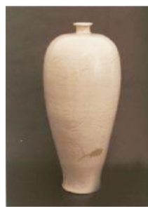
图2 定窑白釉刻花缠枝牡丹纹梅瓶 Fig.2 Ding glaze carved with peony pattern vase