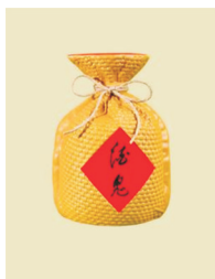
图3 “酒鬼”酒包装 Fig.3 "Jiugui Liquor" packaging

中庸思想强调“过犹不及”,具有文化的包容性,这就要求包装设计能够与时俱进、不断创新 [7] 。在全球化进程日益加快的今天,外来文化大量涌入,对中国人的审美观具有一定的影响。但审美观是以民族文化为基础的,中国人的审美观依然是以中国传统文化为基础,同时融入了外来文化的某些价值观念。因此,在包装设计中,应该以中国传统文化元素为基础,增强满足人们精神需求和现代性元素,实现包装设计中以中华文化为基础的文化融合。“竹叶青”茶叶品牌包装见图4,陈幼坚设计的“竹叶青”品牌茶叶包装将图形设计成修长的形似“竹”字的造型,体现了茶叶的品质以及品茗者追求的君子情怀和修身文化。