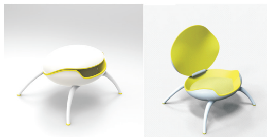
图3 《太空一号》 Fig.3 "Number One"

创意麦编家具要遵循现代家具设计原则,既要保留传统麦编艺术的韵味,又要改变传统的家具观赏风格,要体现时尚性和情趣性,在设计过程中,将现代科技融入传统工艺 [6] 。此类家具的美感在于材料的表达,创造新家具的同时还需保存麦编朴素、清新、简练的艺术特色,赋予麦编艺术新的生命表现力。例如学生作品《太空一号》就是利用麦秆与聚氨酯材料结合制作而成,椅子形态模仿太空飞船的椭圆形态,采用贝壳开合方式,整体又好似外星生物开口笑的俏皮可爱状态,打开背盖展现舒适的麦草编织成坐面,其工艺采用压三挑四的平编法,手工麦编坐垫结合外观光滑洁亮的塑材,现代时尚中透露出以人为本的体贴,如图3。