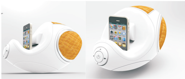
图4 CONCH音响 Fig.4 CONCH sound

与技术,弥补了现有麦秆制品的材料单一性、设计陈旧感,为开发麦编产品的创新思路做出了示范。