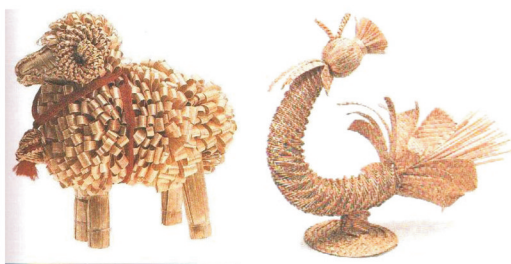
图2 麦编工艺品 Fig.2 Straw woven artwork

麦草编织工艺品中有许多以动植物为题材的,制作者对大自然的生态模拟表达了他们对田园生活的真实观察与挚爱。他们根据鸡、羊、马、鸟等动物原型加以自我的想象与变形,让这些可爱的麦编工艺品造型上繁简合一,惟妙惟肖 [4] 。麦编工艺品“绵羊”与“公鸡”在造型上都凸显了特征,利用麦秆弯曲打卷形成了羊身绵密的绒毛,而公鸡的仰天长歌的神态与身体架构,是通过麦秆编辫缠绕而成。这些工艺品在造型上可以说是真正做到了“取其形、延其意、用其神”的创作手法,通过表象、意象、变形,使它们活灵活现的出现在我们的生活中,见图2 [4] 。