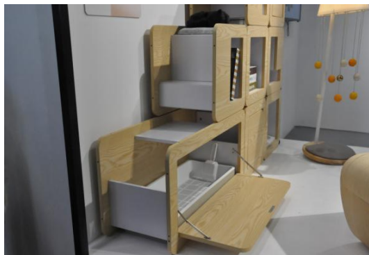
图4 隐藏式猫砂盆设计 Fig.4 Hidden design of cat litter box

题为“主子与我”的人与猫共享的家具产品,于2018年与2019年分别在意大利米兰家具展与中国深圳家具展亮相。它包含具有休憩功能的餐桌与靠背椅,具有攀爬功能的阶梯状书架,具有登高远眺功能的挂衣架和可玩耍的落地灯,以及小方凳、茶几,见图3。