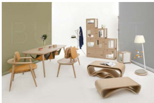
图3 “主子与我”系列家具 Fig.3 “ME & MEOW” furniture