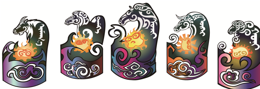
图6 “沙嘎”图案视觉重组 Fig.6 Visual recombination of “Shaga” pattern