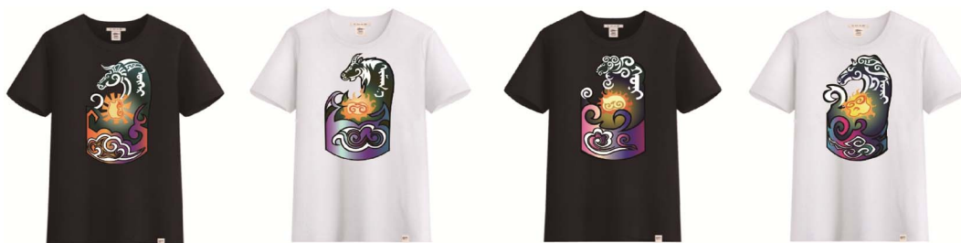
图7 文化衫 Fig.7 T-shirt