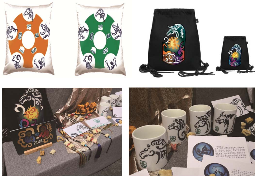
图8 系列文化产品设计展示 Fig.8 Design and display of series cultural products