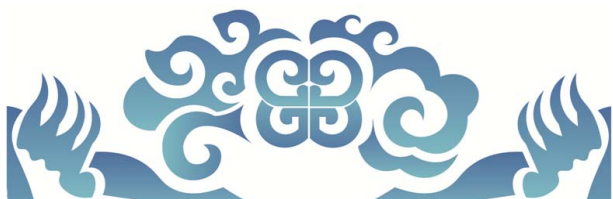
图4 与蒙古族传统纹样结合的“沙嘎”图形 Fig.4 “Shaga” graphics combined with Mongolian traditional pattern