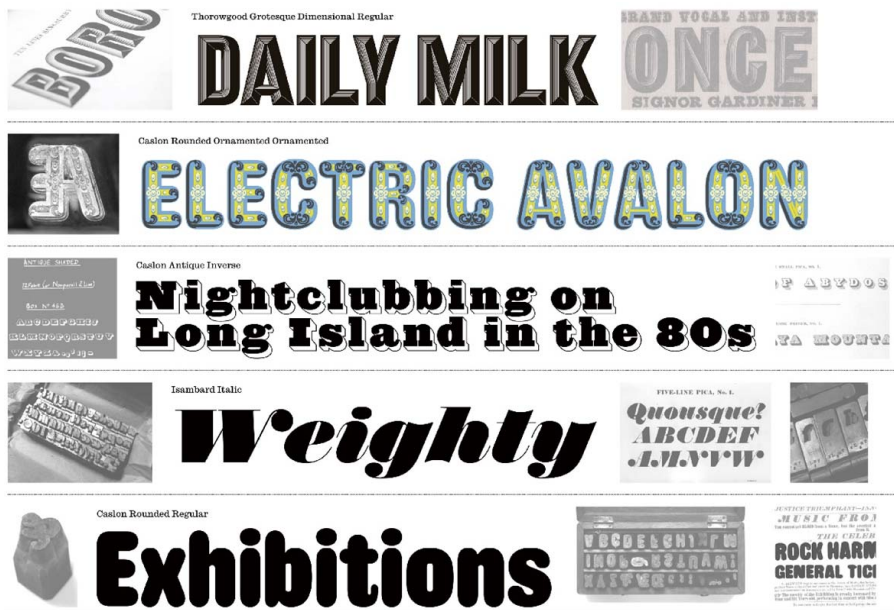
图1 Commercial Classics 官网首页 Fig.1 Website homepage of Commercial Classics

汉字传统的水墨书写造就了文字虚实的层次变化，而数码字体是由计算机矢量路径控制的闭合轮廓，如何呈现或者是否需要呈现书法字的虚实形式，也是汉字遗产数码复刻的核心问题之所在。