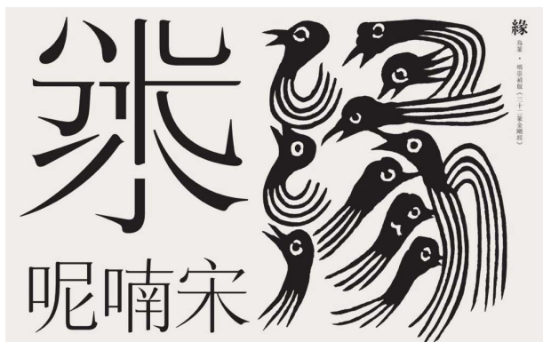
图4 洪卫设计作品《呢喃宋》

形意结合也可以通过汉字局部进行艺术化处理,如恰当运用装饰元素赋予字形更深层次的意义,或直接将文字的笔画或局部画成物象 [12] 。例如,方正呢喃宋以篆书中的鸟篆为灵感,将抽象化的“鸟头”形态作为装饰元素融入宋体字笔画,呈现了一款具有传统人文气韵的宋体字,见图4。鸟篆的融入起到了对字形的美化装饰作用,赋予字体以中国式的视觉情绪,这也是一种对汉字传统设计方法的当代诠释。在当代创意字体的设计中,也存在很多类似的案例,如《民艺》杂志的标题字设计同样运用鸟虫篆、云纹元素,构成具有文化感的当代标题字体设计。