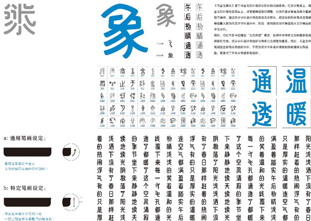
图 3 《仿金文黑体》

例如，仿金文黑体就是利用解构重组方法进行设计的案例，见图 3。在解构重组的设计过程中，笔者将西周金文和当代简体汉字创造性地组合互融，一方面，西周金文笔画、结体特征的融入，使字体延续了西周金文的艺术特点；另一方面，简体汉字结构的融入使字体仍具当代识别性。作品并没有保留西周金文或简体汉字的全部特征，而是经过取舍，在文字识别的差别阈限内，融合古今文字，形成了一组具有西周金文特征的当代创新字形。虽然，金文结体的融入更加能够承载西周金文的艺术特点，但也使本组字体与简体汉字的字形标准出现一定的差异。