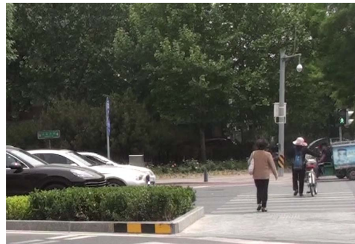
b 未注视来车不减速