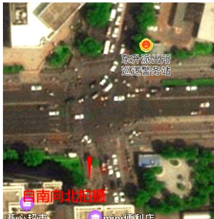
图2 荷清路与成府路交叉口 Fig.2 Intersection of Heqing Street and Chengfu Road

同行人数及红绿灯状态 4 个指标进行分类：1) 性别分为男性和女性。2) 由于未成年人易出现突然冲出的抢行现象，老年人通常采取保守的过街策略，二者与成年人的过街策略不同，因此将过街行人年龄分为 3 段：未成年人、成年人和老年人。3) 同行人数是记录行人在过街时是否结伴而行，或者有无同行过街的行人。同行人数的多少会导致过街行人从众心理的产生，从而影响过街行人穿越交叉口的行为决策，导致违章现象的产生。因此，根据以往由于同行人数不同导致行人过街时违章的研究，将同行人数分为 3 种类型，分别是 3 人以下、4~7 人及 8 人以上。4) 红绿灯状态为红灯和绿灯两种状态。