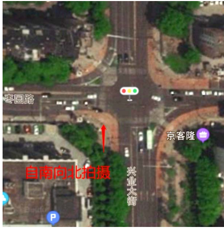
图1 兴业大街与枣园路交叉口 Fig.1 Intersection of Xingye Street and Zaoyuan Road