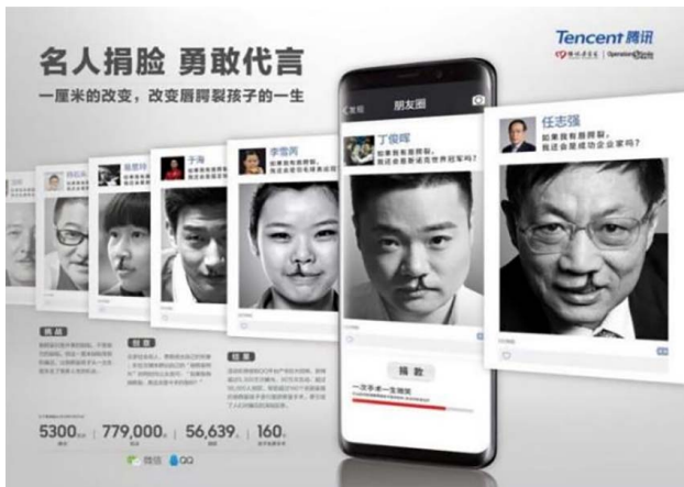
图 8 名人捐脸公益广告 Fig.8 Public service advertisement of celebrities donating their faces

晒出自己的唇腭裂照片, 同时发问: “如果我有唇腭裂, 我还会是今天的我吗?”, 并且超过 7 万的普通人也“捐出”了自己的脸, 帮助唇腭裂孩子重拾微笑。此公益活动利用名人效应打破公益和各个圈层之间的隔膜, 以捐脸为主题, 通过反问的形式与观众进行互动, 观众利用换脸程序体验唇腭裂, 将自己代入, 自发对唇腭裂儿童产生更多的关注。同时, 借助移动社交平台制造社会话题, 以创意设计释放公益活力, 实现互动联结, 从而达到传播势能最大化。