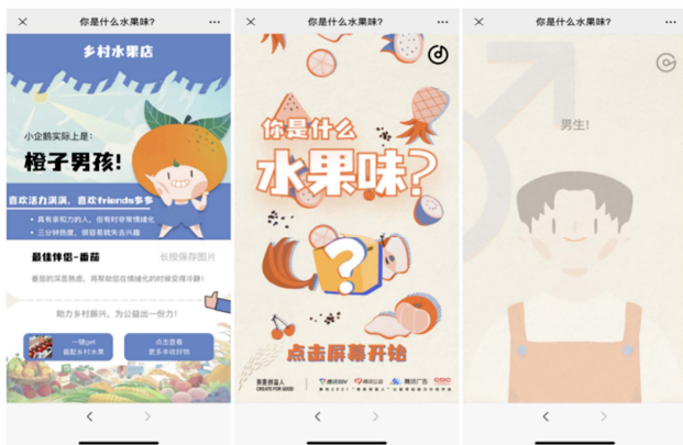
图6 “你是什么水果味”公益广告

游戏化公益广告是时代发展的产物,也是有效的交互式叙述载体之一。随着移动社交成为用户相互交流、获取信息、分享个性的生活方式,社交游戏成为交互式公益广告的新载体。以互动H5公益广告“你是什么水果味”(图6)为例,此广告摒弃了传统的图文推送方式,利用新兴互联网传播形式,通过年轻人喜闻乐见的人格测试,定格“个体水果味”,顺势引导至相应的水果购买平台,实现购买行动的召唤,直接助力“共同富裕”的目标。此广告基于移动社交互联网平台,拥有公益信息透明化、大众化的特点,能够触达最广泛的人群,让青年学子、都市白领、社会公众都能以最便捷的方式参与到公益之中,利用移动社交的优势触发二次传播,进一步实现公益可持续。