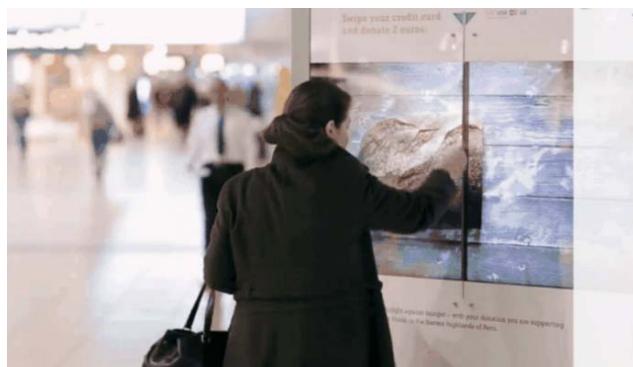
图2 米索尔基金会可刷卡的广告牌: The Social Swipe Fig.2 Social Swipe billboard of the Mercer Foundation

设置于公共环境空间中的公益广告如果在创意设计能引发公众参与的兴趣,则将产生线下行为互动。线下行为互动能够使公益广告所要传达的痛点问题更易被感知,实现有温度的公益操作行为。以“米索尔基金会可刷卡的广告牌: The Social Swipe”公益广告互动装置为例(图2),将一台互动广告牌刷卡机放置在公共场所,广告牌屏幕中间部位有一道可刷卡的槽,每当捐赠者刷一次卡,就会切开屏幕上的一片面包或隔断绑住双手的绳子,并向第三世界的贫困者捐出2欧元。相比于直接的、冷冰冰的募集捐款,此公益捐赠流程简单且具有“立竿见影”的效果,这种互动方式让捐款变得更有温度。通过视觉和触觉的双重刺激,丰富了公益感知的维度,强化了参与者的主动意识——从浏览公益信息转向参与公益传播,进而提高对公益广告的关注度。