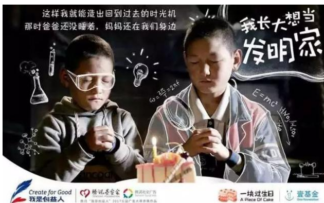
图 5 “一块过生日”公益广告 Fig.5 Public service advertisement: "Birthday together"

有学者认为, 游戏化公益广告不仅文本内容是纯粹的公益, 而且其游戏规则具有强烈的公益意识性,