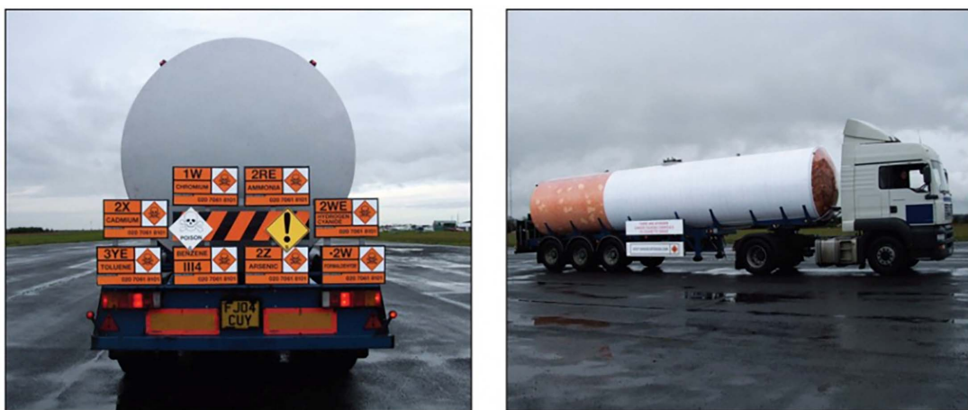
图 9 “吸烟危险”公益广告 Fig.9 Public service advertisement: "Smoking danger"

另一方面, 环境媒体广告基于广告信息、广告载体及媒介环境进行创意设计, 能够创设特殊的情境来促使用户产生一定的情感体验, 从而引导受众更侧重于广告所要传达的信息。除了利用创意设计创造出新的视觉形象, 强化户外公益广告的效果, 还可以利用感官之间的转化产生比真实场景更真实、更精彩画面。有学者提出: “在广告设计中, ‘通感’技法用于传达不同感官的感受。通过联想, 情感得以传递和交错, 可以产生比真实情景更加真实和奇妙的意象。” [16] 当某一信息的感知特性不明显时, 通过通感可合理利用感官转化公益信息, 进行辅助感知。以浙江省环境保护厅开展“千里无‘霾’, 始于足下”公益活动为例 (图 10), 在杭州最繁华的武林路, 将公交站台的灯箱改装成互动装置, 通过灯箱内的摄像头对道路上的车流进行实时测量, 将每一辆车排放的尾气都量化为 PM2.5 指数并转化成直观的、实时变化的人体伤害, 屏幕里的模特也会依据 PM2.5 的含量做出相应的反应 (捂鼻、咳嗽、戴口罩等), 灯箱屏幕也会变得模糊不清直到完全黑屏, 相反, 车流量减少时, 模特的反应又会恢复正常。此公益广告投放在在公交站台这个特