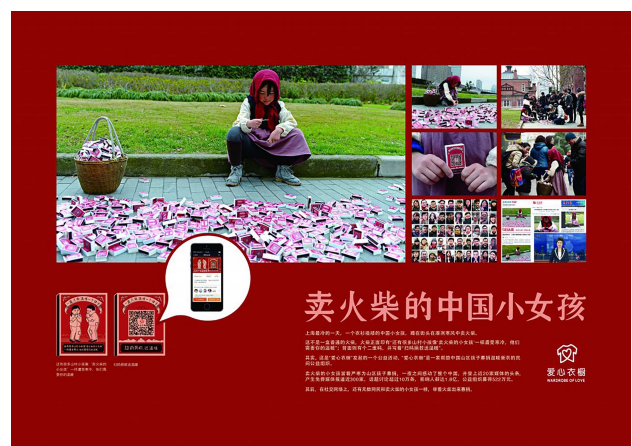
图7 “爱心衣橱,扫码送温暖”公益广告

公益广告中的情感诉求可以引起大众共鸣,强烈的情感冲击引导着大众的公益参与。在融媒体环境下,以平铺直叙的方式展现公益情感或许缺乏力量,如果以情感为纽带传播公益主旨则更易升华公益主题,强化公益传播的效果。以“爱心衣橱”公益项目发起的“爱心衣橱,扫码送温暖”(图7)公益活动为例,活动以“卖火柴的小女孩”为公益切入点,一个衣衫褴褛的中国小女孩蹲在街头,在凌冽的寒风中卖火柴,火柴正面印有“还有很多山村小孩像‘卖火柴的小女孩’一样遭受寒冷,他们需要你的温暖”的句子,背面则有个二维码,并写着“扫码捐款送温暖”。不像传统公益广告说教那般,共情互动公益为人们讲述了一个大众熟悉的故事,牵引用户的思维,使用户在不知不觉中进入公益故事,情感共鸣有着极强的引导力和感染力,使用户感受到的视觉信息与内在情感产生关联,从而刺激用户行为的发生。