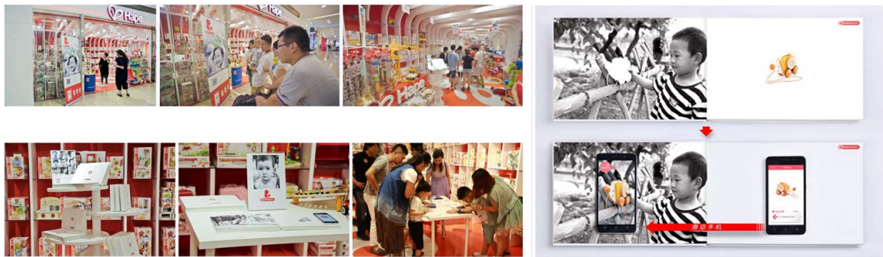
图 4 “举手之善”公益广告 Fig.4 Public service advertisement: "kindness like lifting your finger"

值需求。随着数字化时代的到来, 在技术驱动下, “科技+文化”的融合创新带动了传媒业的发展, “科技+公益”也正在成为解决社会问题的重要力量。越来越多的公益广告中融入了新的技术, 如 NFC、AR、VR 等。德国玩具品牌 HAPE 在中国儿童慈善活动日推出了“举手之善”活动(图 4), 把芯片植入到 HAPE 玩具店的广告交互页面中, 运用 NFC 技术, 将手机贴近玩具并向左滑动, 玩具就会神奇地出现在画面里孤儿的手中, 消费者在为自己的孩子购买玩具的同时, 就会有另一个同样的玩具赠送给孤儿。公益广告针对不同群体应有不同的设计表达, 该公益广告精准定位目标受众, 立足于孩子对玩具的兴趣, 利用新技术联结不同地区的孩子, 有针对性地进行公益传播, 在提升公益信息表现力的同时, 更能够切实提高其传播效益。