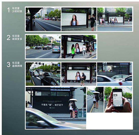
图10 “千里无‘霾’,始于足下”公益广告 Fig.10 Public service advertisement: "Thousands of miles without 'haze', starting from the first step"

殊的情境里,利用“通感”手法将尾气排放转化为虚拟广告中模特的不同反应,实现了虚拟与现实的交流,更直观地让人们切身处地开始思考,吸引用户关注,提高了用户公益主动性,以此达到低碳出行的行为改变。