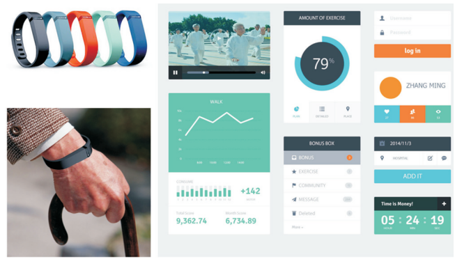
图2 针对老年人运动的服务设计 Fig.2 Service design for elderly exercise

互联网信息技术应用使得围绕某一社会需求的数据发掘和信息整合成为可能。例如,大数据在医疗行业的应用普及,不仅表现为量大、繁杂,其中蕴含的信息价值也是丰富且多样的 [9] 。随着医疗资源在社会范围内的优化整合,及其在社会福利上的关注和投入,医疗健康服务作为一种公共力量在保持社会融合度和缓解社会问题上发挥着重要作用。姜灿、胡晨颖设计的针对老年人运动的服务设计见图2,它针对老年人运动这一场景,通过老年人所配备的可穿戴设备监测其体征状态,可及时应对突发情况,并将所收集的数据汇集到健康中心进行处理,用于集中管理和分析老年人的健康状况。此外,这些