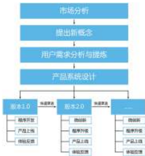
图1 互联网产品迭代设计过程