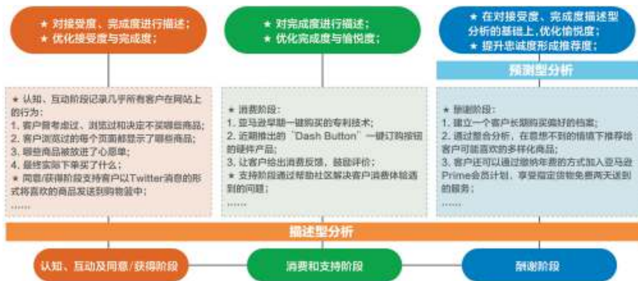
图3 亚马逊购物网站体验设计分析

创造伟大的服务体验取决于发现数据并在真正有益于用户的情境下使用数据,情境和情境衍生的分析能够释放储存于大数据中的潜力 [9] 。通过将数据置于情境中,企业能够提升客户洞察以及识别客户平常行为背后的原因,避免对平均度量指标数值的误读 [10] 。尤其是情境分析对预测分析具有极强的补充作用,能够解释用户行为背后的心理状态,形成真实而细致的关联分析,从而创造出真正取悦用户的体验。例如,网络商家通过预测分析网络可以得出一些用户会在周五的下午购买鞋子,但是情境分析将让他们明白大部分这些客户在写字楼办公,并且当用户在等待一个客户或会议时(1 h 中的前后 5 min),更有可能出现购买行为,商家可以依据用户重复的购买习惯向用户展示相关商品信息实现精准营销,因此,大数据分析下网络消费体验设计理论模型由3个层面构成:(1)内容层面,以客户生命周期为基础的网络消费体验旅程;(2)方法层面,客户网络消费体验旅程的5个度量指标体系;(3)技术层面,描述型、预测型分析与情境分析相结合。其中,内容层面表现为具体的体验设计内容,方法层面通过数据分析监控体验完成目标的过程,技术层面与方法层面与内容层面的实施提供了技术支撑。大数据分析