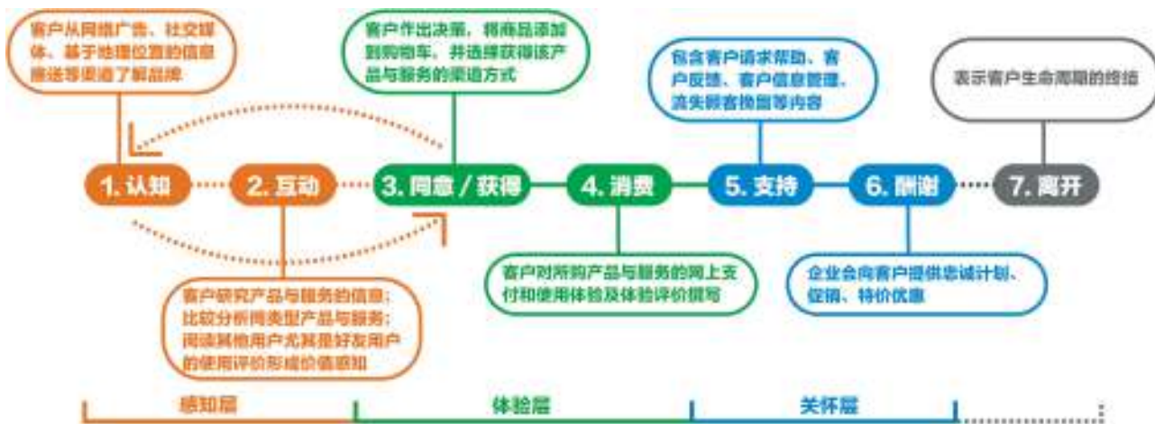
图1 客户网络消费体验旅程

为了让企业更加全面地理解客户与产品和服务的关系,发现客户作出选择的驱动因素,企业需要从客户生命周期视角观察网络消费体验旅程。(1)认知:在客户网络消费体验中,客户可以从网络广告、社交媒体、基于地理位置的信息推送等渠道了解品牌;(2)互动:客户可以利用网络搜索、观看产品与服务的介绍影片研究产品与服务的信息,同时比较分析同类型产品与服务,阅读其他用户尤其是好友用户的使用评价,来对所选的产品与服务以及它们的价格形成价值感知;(3)同意/获得:客户在上述两个环节的基础上对购买一个产品或服务作出决策,将商品添加到购物车,并选择获得该产品与服务的渠道方式;(4)消费:包含客户对所购产品及服务的网上支付和使用体验及体验评价撰写,其中简单易用的网上支付与使用体验能提升客户对产品及服务的满意度;(5)支持:包含客户请求帮助、客户反馈、客户信息管理、流失顾客挽留等内容;(6)酬谢:企业会向客户提供忠诚计划、促销、特价优惠;(7)离开:表示客户生命周期的终结。客户网络消费体验旅程见图1(文中图片皆由笔者绘制)。然而,任何一个客户都不太可能按照上述先后次序来完成各自的客户生命周期,每个客户都有其独有的周期旅程。例如,新客户在互动阶段,可能会结