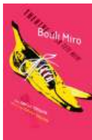
图3 黑头剧院招贴作品 Fig.3 Black Theater poster

创作情感 [4] 。如法国设计师弗朗西斯·卡西博为黑头剧院设计的招贴作品，见图3。设计师选择了玫红、亮黄两种饱和度极高的色彩作为画面主色调，既吸引了受众的目光，又传达了一种愉悦感。装饰性、表现性的色彩。儿童由于没有专业理论引导，其所运用的色彩往往来源于自身对于美的主观想象，呈现出浓重的装饰性与表现性。在平面设计中，设计师可运用单纯色块的拼凑与变换，来传达色彩的装饰性与表现性。以加拿大平面设计师塞利鲍勃设计的一款乐队海报为例，见图4。设计师将蓝、紫、粉红、黄等色块，发散式地拼凑成一张人脸，色块深浅交错、冷暖穿插，视觉效果鲜艳、明快，充满了隆重的装饰感。