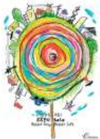
图5 创意世博海报作品 Fig.5 Creative Expo poster

据儿童心理学分析，儿童画构图较为随性，无规律可循，多为散点式构图，焦点、透视等深层次的构图无从谈起 [6] 。儿童在构图过程中不会受到描绘物象的实际大小以及画面布局的影响，仅仅凭借自身的、纯粹的主观意识即兴而做，将大脑中所想象出来的事物毫无规则地塞进画纸之中。这种构图充满了强烈的运动感和失重感，与此同时也呈现出自由感以及稚拙的梦幻之感，给受众一种返璞归真之情。世界著名艺术家康定斯基的作品《即兴》，见图6，就是借鉴儿童画中的无规则散点式构图法，无论是画面的线条、造型还是物象色彩等，都随意散乱在画纸之上，充满了强烈的律动感，受众在观赏之余会心生一种对生命的敬重与热爱之情。