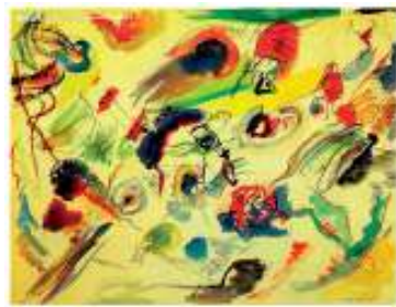
图6 康定斯基的《即兴》 Fig.6 Wassily Kandinsky's "Impromptu"