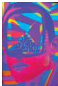
图4 乐队海报 Fig.4 Band poster