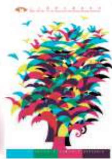
图2 台北国际视觉展海报 Fig.2 Taipei International Visual Exhibition poster

创作情感 [4] 。如法国设计师弗朗西斯·卡西博为黑头剧院设计的招贴作品，见图3。设计师选择了玫红、亮黄两种饱和度极高的色彩作为画面主色调，既吸引了受众的目光，又传达了一种愉悦感。装饰性、表现性的色彩。儿童由于没有专业理论引导，其所运用的色彩往往来源于自身对于美的主观想象，呈现出浓重的装饰性与表现性。在平面设计中，设计师可运用单纯色块的拼凑与变换，来传达色彩的装饰性与表现性。以加拿大平面设计师塞利鲍勃设计的一款乐队海报为例，见图4。设计师将蓝、紫、粉红、黄等色块，发散式地拼凑成一张人脸，色块深浅交错、冷暖穿插，视觉效果鲜艳、明快，充满了隆重的装饰感。