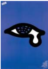
图8 福田繁雄的招贴作品 Fig.8 Shigeo Fukuda's poster poster