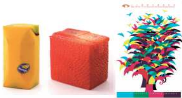
图1 深泽直人设计的果汁包装 Fig.1 Juice packaging by Naoto Fukusawa

儿童画色彩的表现方式可概括为两点。强烈直接的色彩。儿童开朗、活泼的心态决定了儿童画色彩的高纯度性与高对比性。借鉴这一特点，设计师可减少平面设计中的中间色和复色的用量，加入一些明度与纯度较高的色彩，以此传达直接而热烈的