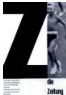
图7 巴塞尔博物馆招贴作品 Fig.7 Basel Museum poster

象 [7] 。儿童画构图以非对称式构图为主，阿恩海姆曾对此作出解释，儿童在致力于绘画之时，往往比较倾向于忽略掉物体之间的对称关系以及整体画面的表现 [8] 。虽然儿童画没有对称式构图的指导，但是其画面却不失均衡稳定之情，反而多出了一些趣味性、活泼性、节奏性以及韵律性，深得受众喜爱。如瑞士著名的平面设计大师艾尔米·鲁德比较青睐于非对称式构图，他为巴塞尔博物馆设计的招贴作品《报纸》，见图7，就是典型的非对称式构图。画面中照片、文字均以非对称形式出现，画面干净简洁，但视觉效果却十分突出，作品暗示了潜在的统一性，寓意博物馆馆藏之丰富。