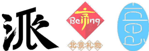
a “派”服饰标志 b 北京礼品标志 c 得意文化设标志

的做法是找出与汉字“合文”的同意字母或单词,努力发现它们之间形态的相似性,巧妙地让其结合在一起,产生一种亦中亦西的视觉感受,使标志具有“双语”的功能,更具民族化和国际化特征。如陈幼坚设计的服饰标志“派”见图 5a,字母 \pi 与汉字“派”巧妙结合,个性独特。陈楠设计的北京礼品标志见图 5b,用“京”与“Beijing”文字相似部分“合文”,设计成双语字。得意设计的得意文化设计标志见图 5c,“意”与“idea”(顺时针转 90°)正好重叠,汉字与字母“合文”在形式、含义的配合上可谓相得益彰。在资讯、信息发达,交流频繁的当代语境下,汉字与字母“合文”的汉字标志更具民族性与世界性,更有助于视觉信息的快速与准确传达。