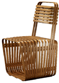
图2 椅君子 Fig.2 Junzi chair

竹子的原色, 主要以天然竹条为主, 造型则是形似“君”字。中国自古就有梅兰竹菊“四君子”和岁寒三友的“松竹梅”之说, 因此在这件家具上就可以感受到中国竹文化的影子 [7] 。