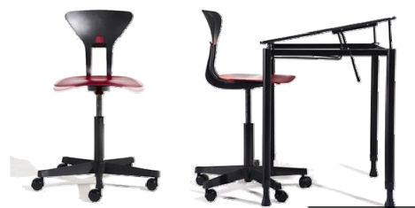
图1 促进学龄儿童健康的人体工程学座椅 Ray Fig.1 Ergonomic chair Ray to promote school-age children's health