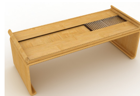
图3 竹材质的茶几 Fig.3 The tea table of bamboo material

人们往往更加喜欢对称的物品, 笔者设计的竹椅见图4, 因为人们对对称的面孔和身体的偏爱直接反映着最优选择。由于竹的天然特质, 一根根竹条上的斑点, 若隐若现地呈现在竹椅表面, 形成了自然和谐又规律不一的装饰图案。竹椅的设计具有一种清晰明确的艺术感, 它的造型简洁, 色泽圆润, 呈现出一种虚中有实, 实中透虚的节奏美感。在竹家具造型中, 材质的表达主要以点、线、面为主。这件产品主要运用线的表现手法, 用线材表现的形态, 具有流畅的运动美感, 它既可以作为家具的主体又可以作为形体的轮廓。这件家具主要以直线材为主, 在视觉情感表达上, 给人明确、干练、纯净的印象。而椅子底部, 形成块状的表现形态, 具有通透的体量感, 给人稳重, 可靠的感觉。