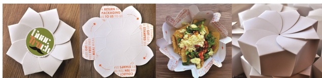
图 4 流动餐馆的外卖包装