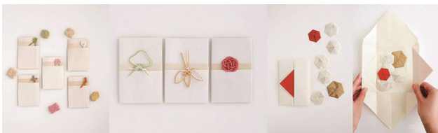
图1 节庆系列包装设计 Fig.1 Packaging design of festival series

日本的山口信博设计的节庆系列包装设计见图1,他的作品会让人联想到江户时代的电影,包装中柔软的和纸和多彩的绳结中传递的正是来自古早时代的朴素温情。精心折叠出的包装,不仅让受礼者看起来赏心悦目,也充分透露出送礼者的审美水平与文化素养。在礼品包装之后系上金银、红白或金色的绳结和缎带,预示吉庆和希望。这种源于民族传统的包装形式,使得日本包装寻找到本土化的气息和现代时尚的语境,创造出风格独特的设计语言。