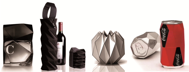
图8 融入折纸元素的包装设计 Fig.8 Packaging integrated with origami elements

东西,加以活用,是比无中生有更有了不起的创造。创意并不是要让人惊异它崭新的形式和素材,而应该让人惊异于它居然来自于看似平凡的日常生活。不断开发出这些创意才是真正的设计 [8] 。”