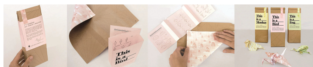
图 7 折纸包装袋