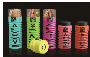
图2 可伸缩的食品包装 Fig.2 Telescopic food packaging

2) 利用科学而巧妙的折纸结构可以达成对物品的保护。单个包装的结构考虑无限循环的空间套叠,不仅可以经济、便捷、低碳地实现储运的要求,同时可以让包装充满智慧,富有情趣 [3] 。西班牙设计师 Mucho 的折叠 DVD 包装见图3,这款创意 DVD 包装由折纸结构构成,在内层中设计有一个巧妙的折页和开口,在打开盒子的同时光盘能够自己“立”起来,完全无需用手去拉取,取用十分方便。