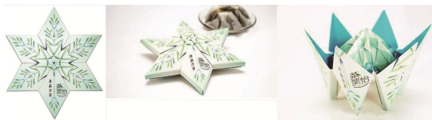
图 6 冷茶包装