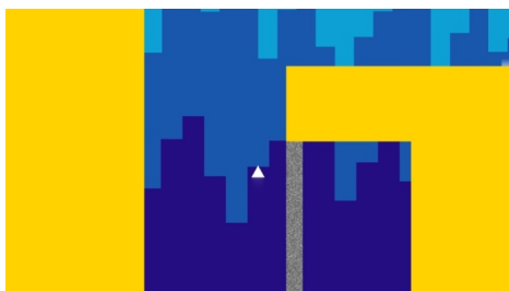
图 2 游戏《孤独的托马斯》配色设计 Fig.2 The color design of "Thomas was alone"