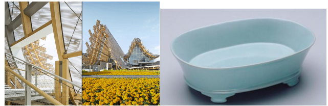
图1 2015年意大利米兰世博会中国国家馆 Fig.1 Italy in 2015 World Expo China pavilion

恰恰契合了“少即是多”的简约主义设计理念。北宋汝窑瓷器,被誉为中国最完美的青瓷。汝窑瓷器以其温润的天青釉色闻名于世。汝窑水仙盆见图2(图片摘自中国国家艺术网),轮廓简约大方,线条转折流畅,色泽温润素雅,整体静雅端庄,宋人所追求的如雨过天青的宁静开朗的美感,都深刻地体现了中庸、含蓄的美学精神,展现出无与伦比的艺术魅力。