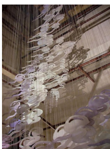
图 4 装置“紫气东来”

呈现模式 [6] 。所谓“形”是指物体的造型、结构和外部形象，是具体的、客观的；“态”则更多地蕴含了情感传递和思想内质，是抽象的、主观的。中国传统文化精神对于形态的理解往往赋予了更多的审美情趣。形态被视为物体的“外形”与“神态”的结合 [7] 。《地理史记》中记载，“喝形”即山水取象之义，源自远古，就是传统文化对于形态认识的较好例证。如果说“形”是设计创意的表现，那么“态”则是设计内涵的赋予。设计师通过形态的暗示功能表达情感，将产品功能和情感意象与形态本身的“形”的特征及“态”的意象所融合才是一个真正好的设计 [8] 。中国驻美国大使馆室内装置“紫气东来”见图 4，其设计元素就是提取中华汉字的形态元素，将象形文字蕴含的中国传统哲学思想和文化价值作为设计表现语言，将“云”、“水”、“雾”、“霓”等各种形态的文字作为天地灵气的象征，整个作品由 300 个左右大小不等的文字构成，赋予吉祥寓意，具有浓厚的东方气质。整个作品的创作参透了对于传统文化的理解，并通过现代设计手段赋予了鲜明的时代特点。