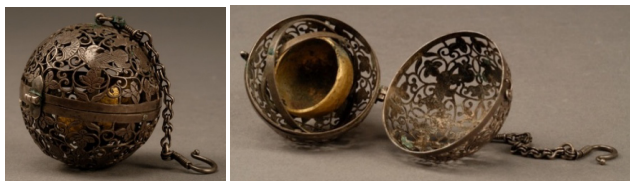
图 3 葡萄花鸟纹银香囊