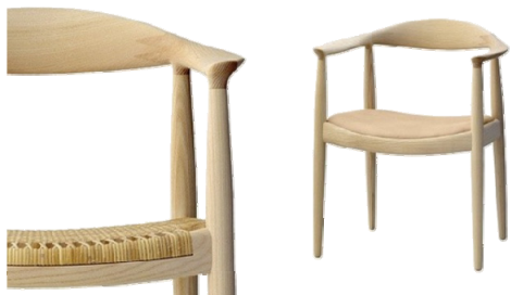
图7 中国椅 Fig.7 The Chinese chair

片摘自爱古网),其简约流畅的线条和科学合理的设计,给予了瓦格纳巨大的设计启示。结合现代主义设计理念,对脚踏、扶手、座面不断修改,打造出这把“中国椅”,见图7(图片摘自中国家具网),成功地赋予了传统明式家具以新的演绎方式。