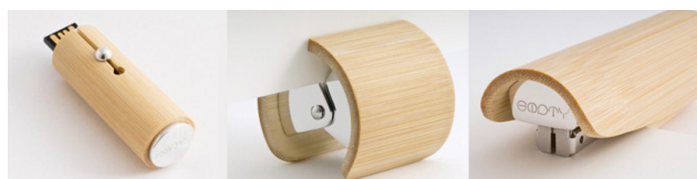
图 5 竹制办公用品

格化的寓意也赋予了现实事物更多的精神承载。恰如季羨林所说：“这种看重品的美学思想，是中国精神价值的表现 [9] ”。比如竹子其笔直的线条和中空的结构被视作君子道德的象征，其高洁的品格及优雅的风韵在设计应用中也赋予了更为深刻的象征意义。竹制办公用品见图 5，由直径大小不一的竹筒设计的办公工具如订书机、U 盘、削笔器等，设计简洁大方，精致典雅又凸显文化气息，同时也兼具环保耐用的功能特性。