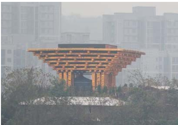
图4 山寨版文化设施 Fig.4 Emulational cultural facilities