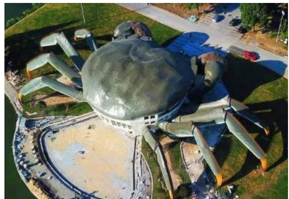
图5 奇葩文化设施 Fig.5 Monstrous cultural facilities