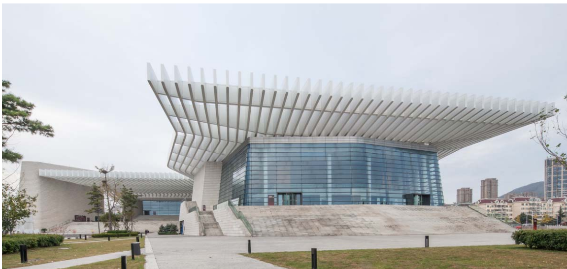
图 7 青岛大剧院 Fig.7 Qingdao Grand Theater

实现信息的有效传达；另一方面还应遵从景观的时空特性和文化特性，构建满足城市功能和形象需求的信息系统，从而使得文化设施信息传达的价值和意义能够得以更好地体现 [10] 。比如青岛大剧院见图 7 所示，其主体建筑歌剧院与音乐厅外观似两架白色的大钢琴，体现出建筑本身的文化特征。各建筑实体之间通过条板梁银顶自然的联结，形成有分有合、四面开敞的布局，流淌出海浪涌动的韵律，亦暗喻出青岛山、海、城浑然一体的地域特色。