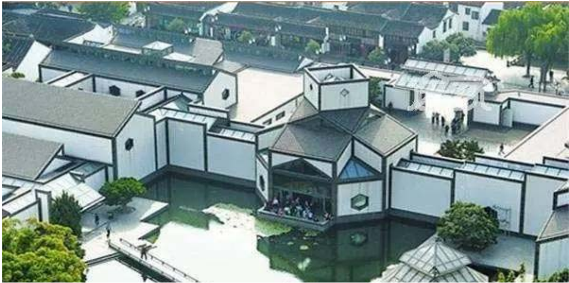
图 6 苏州博物馆 Fig.6 Suzhou Museum