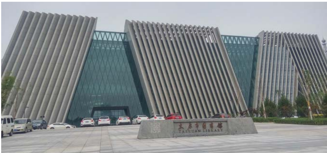
图 2 太原图书馆 Fig.2 Taiyuan library

可意象性要求文化设施所承载的信息能够借助具有特定内涵的视觉符号,并运用重构、象征以及隐喻等意象表现手法进行提炼转换,使之与公众的情感体验及景观的文化属性相融合,从而更易于公众主观意愿上的接受和认同 [7] ,以增强信息传达的效果。比如广州大剧院见图 3,它的设计概念是“圆润双砾”,通过两个多面体主体造型,象征珠江边两块被江水冲