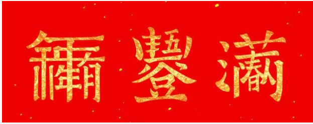
图7 汉字设计 Fig.7 Design of Chinese character