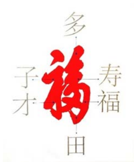
图6 康熙《天下第一福》 Fig.6 Kangxi “The Best Blessing in the World”

供了表现思路和方法,代表形旁的图形和代表声旁的文字可以相互构成融合,赋予文字符号相关意义,进一步表达出文字深层的视觉意象。在形声造字法的基础上总结的“构象赋意”方法为字体创意设计提供了一种视觉联想的视野,即可以通过在文字符号的基础上增加图像,进行艺术化处理,也可以通过对汉字的形符或声符的创意想象,将文字局部替换成相关意义的图像,使意境深远的主题情感以视觉同构的方式得以表达,呈现出图文合体的文字图像设计。汉字的异形同构即是指将两种不同的字体结构构成一个完整的字或字组的形式,通过改变平淡无奇的印刷汉字形象而重新释放出原来字意没有的意外潜能 [4] 。