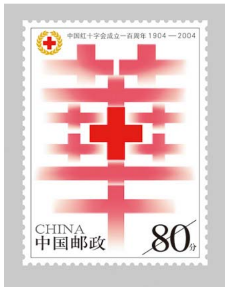
图3 《中国红十字会成立一百周年》邮票设计 Fig.3 Stamp design of “The Centenary of the Red Cross Society of China”

局部之间的关系。指事造字法是在象形造字的基础上，为了表达更为抽象难指的意义，加入理性的判断思考，借用符号的方法来指事的造字方法。象形字经过人为的加重（或显著）、省略（或隐没）和变位（变异转换方位）来而表示文字意思，这就是指事作用 [5] 。和象形文字的直观形象不同，形体是实，事理是虚，指事文字需要通过观察、分析方能发现文字的内在奥秘、了解字的本义。比如汉字“刃”，在象形字“刀”的基础上，添加抽象的指事符号于锋刃的位置，让人更好地理解 and 领会“刃”的含义。汉字“上”和“下”，分别以一横为界限，用上下两符号标示出位置以示区分。古人用事理思维的设计方法表达抽象的事物和概念，充分显示了智慧的思维方式和逻辑推理的能力，对现代汉字创意设计有着极大的启发意义。