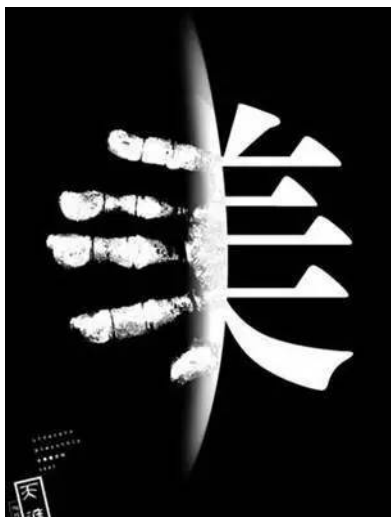
图5 《天涯》 Fig.5 “The End of the World”