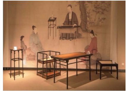
图6 对宋画中家具的复原 Fig.6 Restoration of furniture in Song Dynasty paintings

见了狰狞可畏的饕餮，更多出现了回环往复的雷纹。这一时期的设计观虽仍显神秘，但在神秘当中已经增添了些许浪漫。秦汉时期的家具设计继承了这种神秘浪漫主义的设计观，但在儒家“实践理性主义”思想的影响下，其中又透露出些许轻松的现实色彩和人间趣味。从形式上看，秦汉时期的家具尺度较以往更加宜人，家具装饰逐渐转变为龙、凤、云等更加具象写实的图案；从功能上来看，此时的家具更多地服务于人们的日常生活，原有的用于祭祀神灵的家具或逐渐退出历史舞台（如禁、鼎），或与其他家具一起逐渐人间化了。由此可见，秦汉时期的家具正是构筑了一个“从天上到地下，从历史到现实，从马驰牛走、鸟飞鱼跃到凤舞龙潜、人神杂陈的世界” [15] ，体现出浪漫虚幻而又现实理性的设计观。魏晋南北朝时期长期的动乱促使人们开始对神灵和世人进行反思，进而引发了“人的觉醒”，大唐的开放包容也促使各民族文