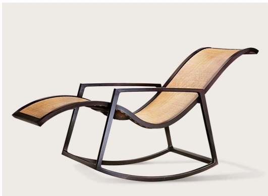
图 9 摇椅 Fig.9 Deck chair

渐呈现出多元化的发展趋势。在新技术、新设备层出不穷的当代，人们应在遵循形式美的前提下，适时地将点、线、面、体等造型元素合理地运用于当代传统家具的设计中，创造出形式更加多元的当代传统家具。