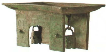
图 1 辽宁省义县出土商代悬铃铜俎 Fig.1 Hanging bell bronze Zu of Shang Dynasty unearthed in Yixian County, Liaoning Province

夏、商、西周时期的青铜家具肩负着稳定社会秩序、落实宗法制度的历史重任 [14] 。其上布满了由巫神文化造就的源于世间而又超越世间的原始宗教纹饰，彰显出神秘、狞厉而又威吓的力量，反映出此时期在原始巫术、宗教控制下孕育出的粗犷而又原始、敬畏而又炽烈的神秘主义设计观。春秋战国时期，漆木家具逐渐取代了青铜家具，家具色彩由凝重沉穆的青铜色转变为蓬勃盎然的黑红两色，家具装饰中已完全不