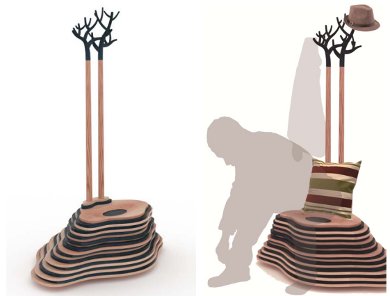
图7 换鞋凳 Fig.7 Shoe changing stool

古代传统家具品类之所以由少及多地演进，主要归因于不同时期人们生活方式的变化。当代传统家具的功能设计必须要根据这些变化进行不同程度的适应与转变 [16] ，进而拓展新的家具品类。如在当代生活中，回家之后“换鞋—挂包—挂衣”的生活习惯已成为一种普遍现象。笔者从这一生活习惯出发，结合山丘和树枝的自然形态，将“坐”与“挂”的功能融合于