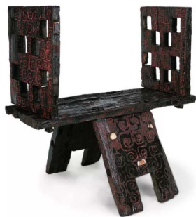
图 2 九连墩 2 号墓出土战国漆木俎 Fig.2 Lacquer wood pawn of the Warring States period unearthed from tomb 2 of Jiuliandun