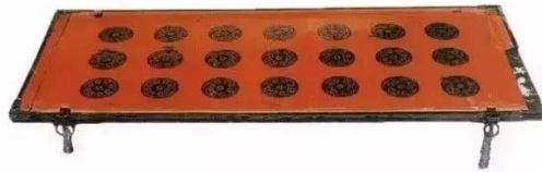
图5 长台关7号楚墓出土战国彩绘漆案 Fig.5 Painted lacquer case of the Warring States period unearthed in Changtaiguan County