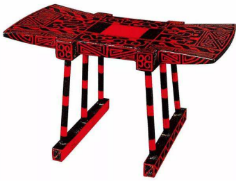
图4 侯古堆1号墓出土春秋漆木俎 Fig.4 Lacquer wood pawn of the Spring and Autumn Period unearthed from tomb 1 of Hougudui