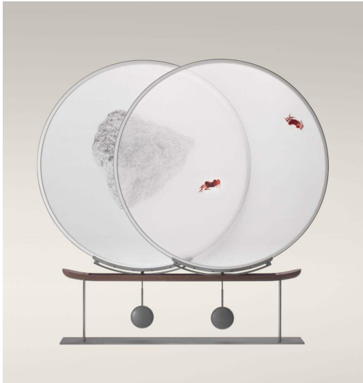
图 8 戏石屏风 Fig.8 Screen