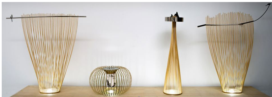
图3 “创意贵州—雷山篇”产出灯具 Fig.3 Lamps design in “Creative Guizhou Activity: Leishan County”