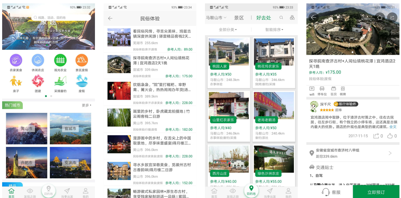
图 2 “爱上农家乐”手机 APP Fig.2 Mobile App “Loving Agritainment”

在乡村旅游精准扶贫智慧化发展与设计,一方面,结合大数据、云计算、地理位置服务(Location Based Services,简称 LBS)等技术,旅游管理机构可以通过海量信息及数据的收集、分析、计算与分享,实时收集来自游客、商家以及景区等各方面的信息,包括出行方式与人数、热度区域、交通状况等,增强信息及时反馈、信息可视化、信息精准推送等体验 [33] 。另一方面,重新定义用户旅程中的关键接触点,为用户提供更加便捷而高效的攻略查询、酒店预定、信息推送、线上支付、社交互动等体验,满足游客旅游前、旅游中、旅游后的“一站式”服务需求,帮助游客完