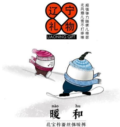
图 2 课题研究成果，应用版小辽蛋 Fig.2 Research project result “Xiaoliaodan” (application version)

IP 是主线，将分散的品牌产品串联起来，形成一个包含内容、人格、用户、场景价值观在内的完整体系，同时由于打通了品牌和产品之间的通路，使得原本分散关系的品牌和产品能够相互配合，破除彼此之间的壁垒。“小辽蛋”也将作为主线，以多样化的形态延展体现子品牌的个性特征，也为辽宁礼物视觉形象的整合提供服务。IP 形象不仅要去做表情的延展设计，为了更加鲜活，还可以设计一个 IP 家族，见如图 3，让 IP 形象更加丰满，也更加有利于故事化的设计。盘锦大米——“湿地印象”设计的 IP 形象见图 4。