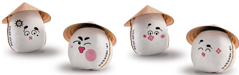
图5 设计研究成果——盘锦大米趣味化包装设计 Fig.5 Design result-the interesting packaging-design of Panjin Rice

盘锦大米全国驰名,在清宣统年间就被定为御贡大米,在民国时期也是东北王张作霖府邸的专供主粮,本次设计实践通过赋予小辽蛋满清皇帝的特征,不仅能够凸显盘锦大米最辉煌的一段历史文化,更可以诱发受众的好奇心,对于把产品品质放在首位的受众则提供了品质优良的历史依据。同时,辽蛋的表情包儿也能够为大米的包装增添趣味,通过情感互动的方式吸引青年消费者的关注。小辽蛋化身为农民的形象(见图5)融入大米的包装设计中,提炼二人转“出相”的表情实现与受众的情感互动。