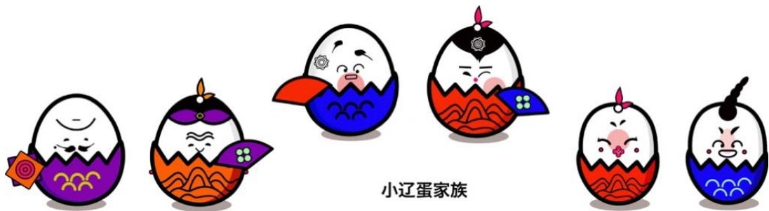
图 3 设计研究成果——小辽蛋家族 Fig.3 Design result-“Xiaoliaodan Family”