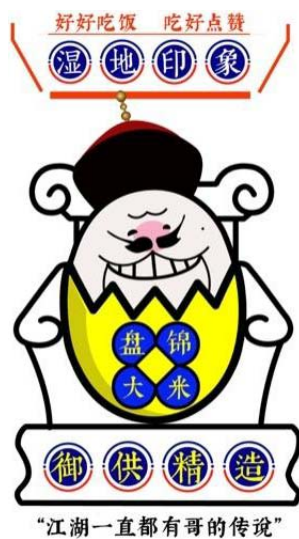
图 4 课题研究成果，应用版小辽蛋 Fig.4 Research project result “Xiaoliaodan” (application version)