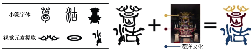
图 1 葛沽镇的品牌形象设计 Fig.1 Gegu Town's brand image design

基于应用场景耦合的设计，是要依据传统村落环境营建应用场景、特色旅游应用场景、特色乡村产业应用场景的需求，对传统村落视觉识别系统形象、主视觉形象、标志物等多种村落品牌形象设计形式和设计语汇进行耦合设计，体现在传统村落标识系统、广告系统、公共设施系统、旅游系统等方面。传统村落品牌形象设计与应用场景耦合，不仅能实现其品牌价值，也有助于自身的推广。因此村落品牌形象的设计