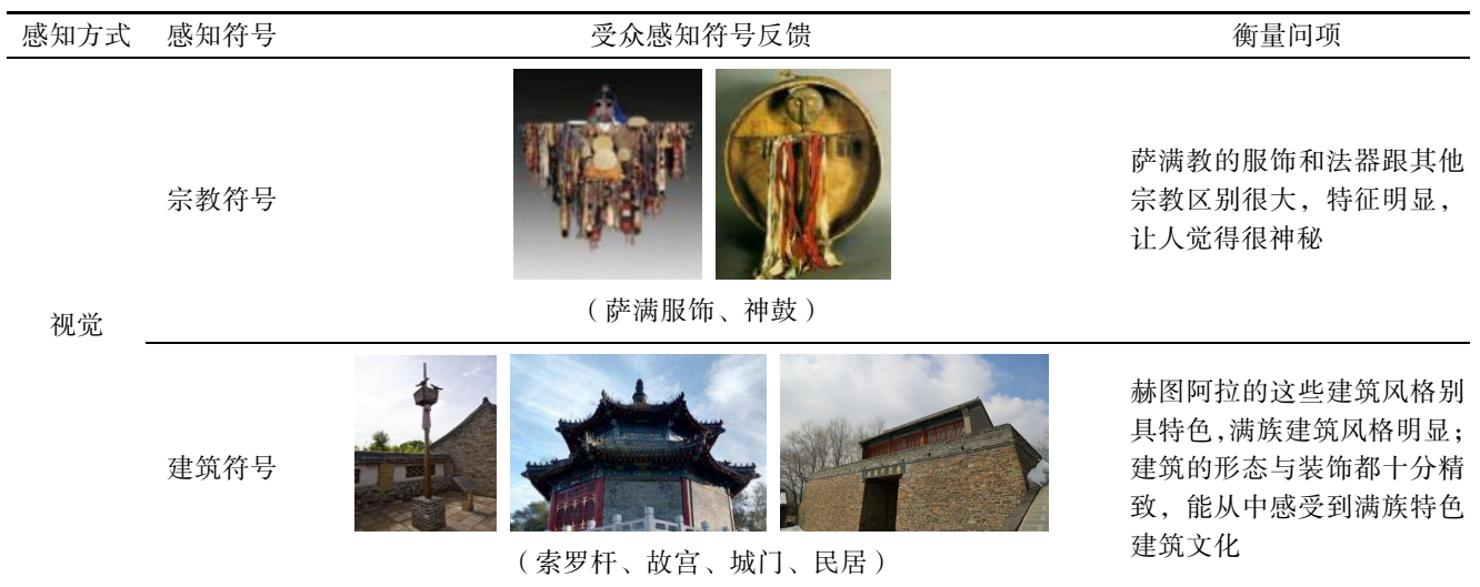
Tab.1 Collation of perceived traditional village brand image design elements