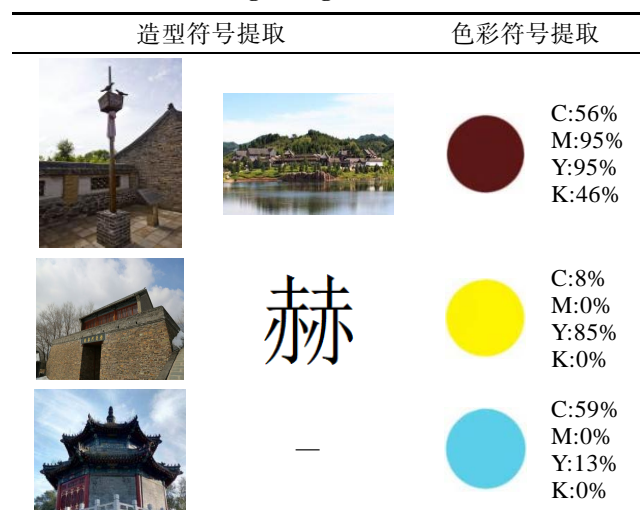
表 2 传统村落品牌形象设计元素提取 Tab.2 Extraction of traditional village brand image design elements

身具有的热情、吉祥、红火、活力的内涵，两者同时象征着赫图阿拉文化生生不息、源远流长的美好寓意，见图 3。