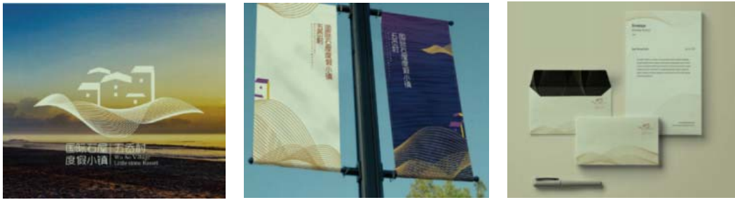
图2 浙江温岭市金山湾五岙村品牌形象设计