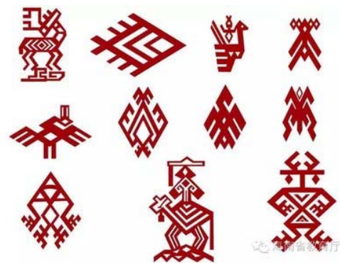
图 4 黎锦图案要素 Fig.4 Pattern elements of Li brocade

化。黎族住在海岛,其物质民俗极具热带海岛风情,主要有黎锦、饰品、编藤、船型屋、山兰酒、独木舟、葫芦舟等,其文化创意产品的设计主要运用黎族民俗文化的外观特征,涉及色彩、肌理、造型、材质、线条、细节加工等元素。在提取黎族物质民俗文化的外观特征时,可以考虑以下几种形式:提取纹样特征、提取外观特征、提取外观局部特征,这些都可以作为了解黎族物质民俗文化的切入口。其中,黎族服饰文化是黎族物质民俗文化中最有特色的艺术,有着漫长的历史,黎族服饰图案多采用在海南常见的具有热带特征的植物、动物、山川等纹饰,如黎锦各种动物的抽象图案,见图 4。黎族传统饰品形式多样、内容丰富,最富于民族特色的饰品是黎族银饰(见图 5),上面的纹饰变化多端,大都象征着吉祥和丰收之意,用凤尾纹寓意和谐和幸福,用云纹和龙纹寓意喜庆,用缠枝纹象征团结和睦,这些纹样可以很好地被提取并应用于现代黎族银饰的设计和开发上。总之,要开发设计黎族传统民俗文创产品,必须以历史为依据、以民俗元素为特色。