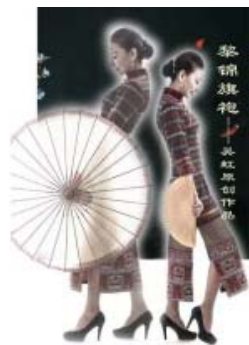
图 10 黎锦旗袍 Fig.10 Li brocade cheongsam