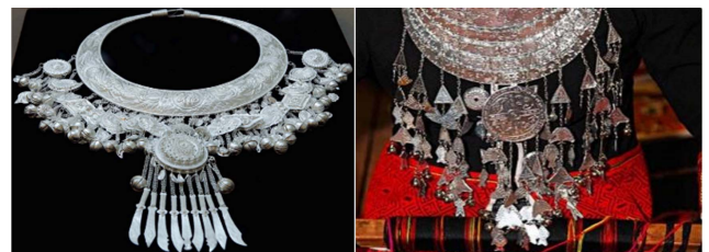
图 5 黎族银饰 Fig.5 Silver ornaments of Li brocade