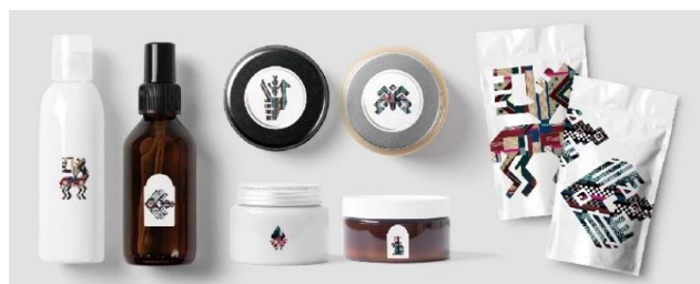
图2 《黎织印象》系列产品 Fig.2 "Impression of Li Textile" series products

黎族传统民俗文化展现出来的文化内涵,充分体现了黎族人民在文化层面的追求,黎族传统文化的核心在于其民族特殊的文化属性,文创产品设计的灵魂是文化,将这样的立意融入文创产品设计中,能够展现文创产品独特的文化品位。在进行文创产品设计过程中,设计者要深入理解黎族传统文化精髓,追求文化的传承与创新,因此,在运用黎族传统民俗文化进行文创产品设计时,设计师不仅要熟悉、了解、深挖黎族传统民俗文化,而且要进一步深入挖掘其文化的内涵和精神,解读其审美形式特征,并发挥其独特的民族风格特征,从而创作出“既富有民族特性又不失现代感”的文创产品,如《黎织印象》系列产品,见图2。总之,依托黎族传统民俗文化的文创产品设计,要以优秀的黎族传统民俗文化为基础,吸收其文化的精髓与价值,增强其文创产品的文化价