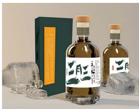
图1 《山栏米酒》包装设计 Fig.1 Packaging design of "Shanlan Rice Wine"

天来看,仍然不失其价值,审美功能要建立在“以人为本”的实用功能基础上,黎族传统民俗文化在文创产品设计中的应用也不例外。设计出来的文创产品因为有用才有其存在的价值,以“用”为中心的本质初衷及实际功能意义,始终贯穿着黎族传统民俗文化发展过程,例如山栏酒、黎锦、独木舟等,既富有民族特色,又满足了黎族生活日常的“用”。黎族传统民俗在文创产品设计中,在讲究实用的基础上,还应不断进行设计的创新,做到与时俱进,通过创新来满足消费者新的审美倾向、功能需求及价值追求,见图1。