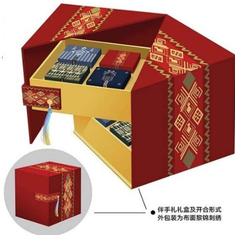
图 3 《这香有黎》系列作品 Fig.3 "Fragrance with Li" series products

依托黎族传统民俗文化的文创产品设计,在形式上要适应消费者的情感需求与审美。当下,黎族传统民俗文化的文创产品设计不断吸收着现代审美理念,继承了黎族传统民俗文化符号的特点,不断尝试并创作了反映时代主题与现代审美的文创产品。例如黎锦中蕴含着和谐幸福、吉祥如意的寓意,也符合广大旅游消费者的情感需求。因此,需要根据消费者对文创产品的情感需求进行设计,如《这香有黎》系列作品(见图 3),与消费者在情感上产生共鸣,这种情感并不只是单纯的美观性、时尚性和情趣性,更是消费者的心理感受,这种感受或是人们触动心灵的一种回忆,或是对往日岁月的一种留念,或是对传统文化的一种认知,这些正是文创产品设计所需要的情感内涵。