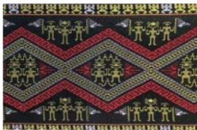
图 9 黎锦披巾 Fig.9 Li brocade shawl

的重要的文化资源。日常生活用品,看似平常,却反映出了黎族文化和民族文化的特质,是文化具体的物质载体。黎族人民在日用品的使用和创造中,有着独特的民俗文化,并深深地扎根在了黎族人民的意识中,对黎族的日常生活有很大的影响。其中,以女性日用品为主进行文创产品设计创新是必不可少的。在如今的黎族社会中,仍能找到母系文化的影子,黎族社会中的女性社会地位较高,具有代表性的纹面文化、黎族织锦文化等活动的主体也都是女性 [7] ,例如运用“黎锦纹饰”创新设计的披巾文创产品(见图 9)、2020 年第三届三亚国际文化创意设计大赛中吴虹设计的黎锦旗袍(见图 10)、三亚慧之彩文化发展有限公司利用黎族符号设计的黎族风台灯系列(见图 11)。这类文化的重心是与黎族女性相关的民俗文化,因此,在进行黎族传统民俗的文创产品设计时,要提取与女性相关的民俗文化,如服饰、饰品、纹面等。以女性日用品为主进行的文创产品设计创新,主要表现形式有黎锦、银饰、斗笠和藤编等。