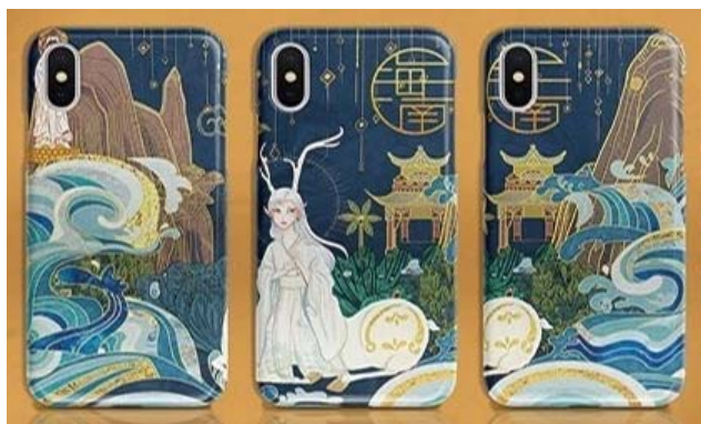
图6 《羁绊》系列文创设计 Fig.6 Cultural and creative design - "Fetters" series

在黎族源远流长的历史中,有许多民间传说被代代相传了下来,这也是黎族民俗文化的重要组成部分。如《大力神》《鹿回头的传说》《五指山的传说》《黎母山的传说》《椰子树的传说》《槟榔的传说》《木棉树的传说》《山兰稻种的传说》等都是黎族珍贵的文化遗产。可以将黎族口承民俗通过情感诠释的文化符号进行提取,主要有以下几种形式:对口承民俗的寓意、精神进行提取;提取口承民俗中体现的设计思维、造物思想,以及可用的设计方法;对口承民俗的历史背景、故事性进行提取;提取口承民俗中与现代生活中相呼应的审美方式。其中,《鹿回头的传说》是黎族民间传说中浪漫唯美的爱情故事的代表 [4] ,讲述了黎族青年和一只神鹿的爱情故事,黎族青年猎手在捕猎时看到了美丽的小鹿,不忍射杀,于是从五指山追到南海边,走投无路的小鹿回头幻化为一位美丽的少女。在这个优美的口承民俗故事符号的提取中,可以把鹿、少女和猎手3个中心要素提取为主要符号,将山上的槟榔树和海浪等背景环境要素提取为边缘符号。《羁绊》系列文创设计见图6。总之,少数民族瑰丽的神话和传说故事,为文创设计者提供了更加广阔想象空间,通过对这些故事符号的提取,并结合相应的场景可以做出不同的设计。