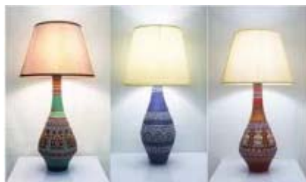
图 11 黎族风台灯系列 Fig.11 Li decorative table lamp

在对黎锦、斗笠进行设计创新时,应该根据黎锦的传统图案进行创新,并提供多种配色方案,如黎锦系列的披巾可以提供暖色系与冷色系,以满足消费者在不同场合的使用需求。暖色调的设计方案活泼清新,适合搭配清爽的休闲服装,稳重的冷色调方案适合搭配通勤装,从而营造出优雅干练的女性形象 [7] 。银饰设计创新较为难做,但是可以在“复古”上下功夫,并挖掘其更多的功能和用途。斗笠创新较容易,可以把富有黎族文化色彩的各种黎锦图案移植到斗笠上,做好竹编或者藤编的设计即可,尽量采用环保的编织图案,避免采用简单的染色方案 [8] 。