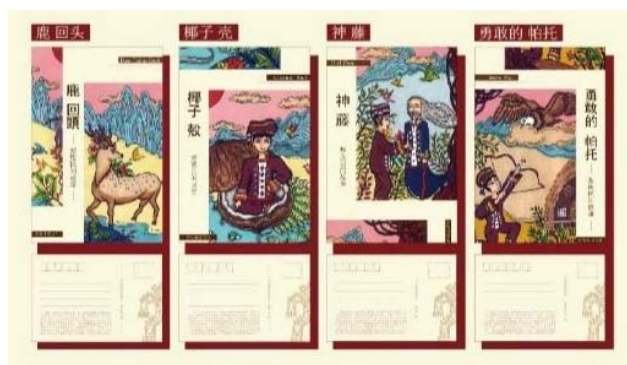
图8 黎族民间故事明信片 Fig.8 Postcard with Li folk story