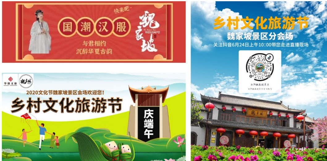
图4 魏(卫)坡村相关艺术活动