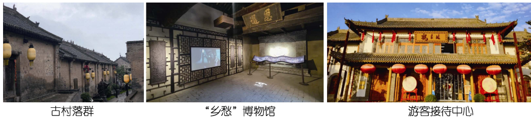
图3 建筑环境修复与设计