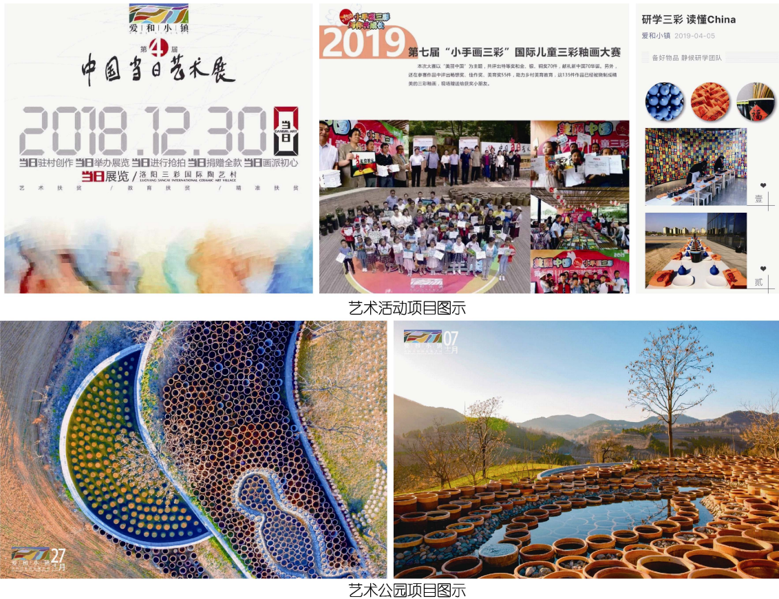
图 5 爱和小镇艺术助力图示 Fig.5 Aihe Town project illustration

护，共聘用 23 人次，每人每年收入可达 2 万元以上（见图 5）。爱和小镇的艺术助力促进了当地文旅产业的发展，近年来年均游客达到 8 万余人次，收入 2 000 余万元，逐步实现了稳定增收，同时也提升了乡民文化自信心与自豪感。