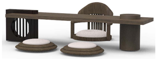
图 4 《极色》 Fig.4 "Simple Style"