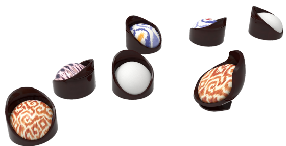
图 6 《乐色》 Fig.6 "Happy Hour"