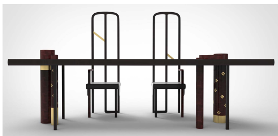
图 3 《莲韵》 Fig.3 "Living Lotus"