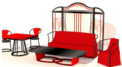
图 5 《东方红》 Fig.5 "Crimson Color"